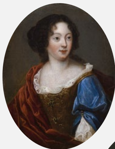
Teresa Kunegudna Sobieska, peintre français, tournant du XVIIIe siècle, Musée du Palais du Roi Jan III à Wilanów

désormais dans le classement comme le fonds 695. La grande valeur de l'ensemble a été mise en évidence dès les premières recherches. On peut notamment y trouver la correspondance entre Marie Casimire et Jan Sobieski considérée comme perdue, les rapports des diplomates et des agents de Jan III en provenance de différentes capitales européennes, ou encore la correspondance familiale de Marie Casimire, datée après la mort du roi. Ce dernier ensemble a constitué le premier champ de coopération scientifique du Musée et des Archives. Le soutien du Ministère de la Culture et du Patrimoine National a rendu possible l'élaboration de la description, les traductions et l'édition des sources visant à leur future publication.