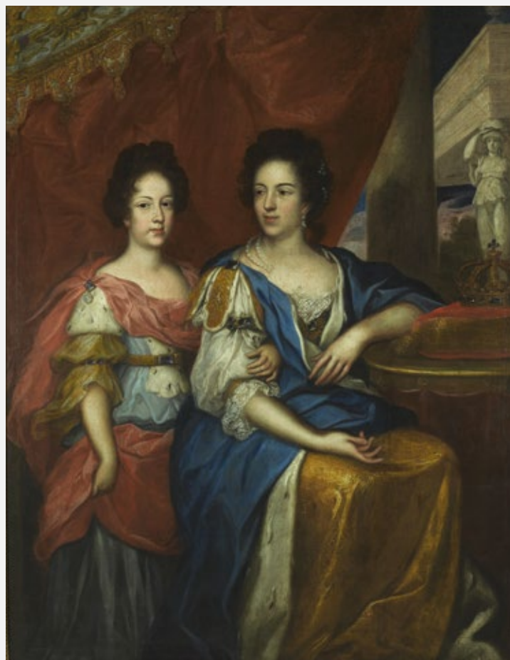
Marie Casimire avec sa fille Teresa Kunegunda, Jerzy Eleuter Szymonowicz-Siemiginowski, ca. 1690, Musée du Palais du Roi Jan III à Wilanów