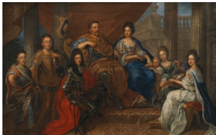
Jan III avec sa famille, peintre de la cour, après 1693, Musée du Palais du Roi Jan III à Wilanów

Dans la collection des Archives se trouvent notamment deux ensembles de documents d'une valeur inestimable : les archives des Sobieski d'Oława (fonds 695) et un très large extrait des archives des Radziwiłł de Nieśwież (Niasvij) (fonds 694) qui contient les archives des Sobieski de Żółkiew (Jovkva). Pendant des années les archives d'Oława ont été considérées comme définitivement disparues aux cours des combats à Berlin en 1945. Cependant, il s'est avéré qu'après la victoire de l'Armée Rouge dans la capitale du Troisième Reich, cette précieuse collection a été transférée à Moscou et ensuite à Minsk. Son existence a pu être révélée au public il y a une dizaine d'années seulement. Peu de temps après, les archivistes de Minsk ont soigneusement préparé les documents de ces archives qui figurent