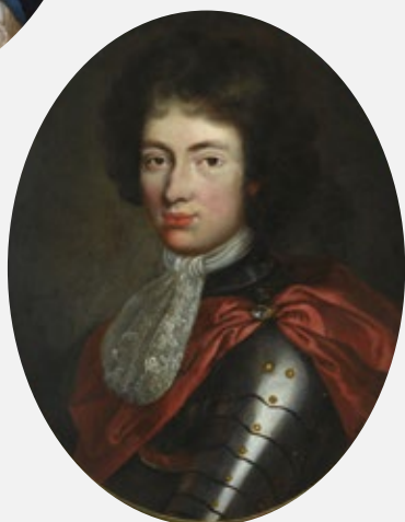
Jakub Ludwik Sobieski, peintre français actif en Pologne, env. 1685, Musée du Palais du Roi Jan III à Wilanów