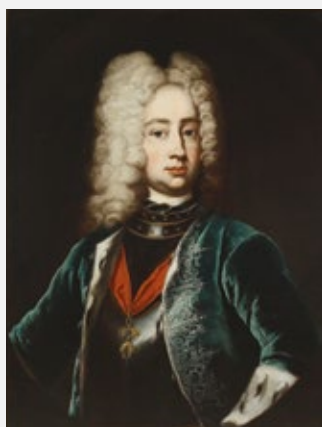
Jakub Ludwik Sobieski, peintre silésien, après 1691, Musée du Palais du Roi Jan III à Wilanów

désormais dans le classement comme le fonds 695. La grande valeur de l'ensemble a été mise en évidence dès les premières recherches. On peut notamment y trouver la correspondance entre Marie Casimire et Jan Sobieski considérée comme perdue, les rapports des diplomates et des agents de Jan III en provenance de différentes capitales européennes, ou encore la correspondance familiale de Marie Casimire, datée après la mort du roi. Ce dernier ensemble a constitué le premier champ de coopération scientifique du Musée et des Archives. Le soutien du Ministère de la Culture et du Patrimoine National a rendu possible l'élaboration de la description, les traductions et l'édition des sources visant à leur future publication.